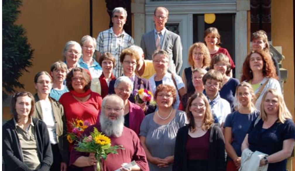
10 Jahre eaf Sachsen