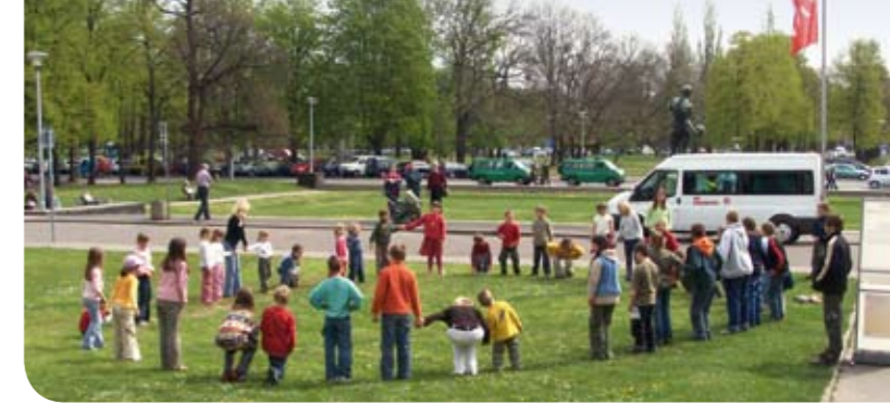
Woche für das Leben 2007: Auftakt vor dem Deutschen Hygienemuseum