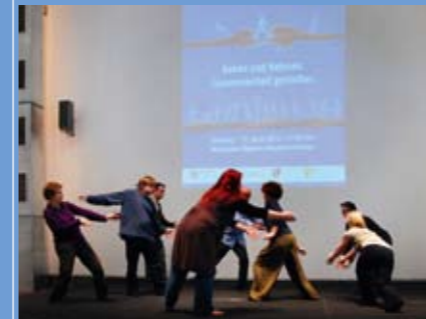
»Woche für das Leben 2013«: Musik von Ballastorchester (oben) Tanz und Improvisationen