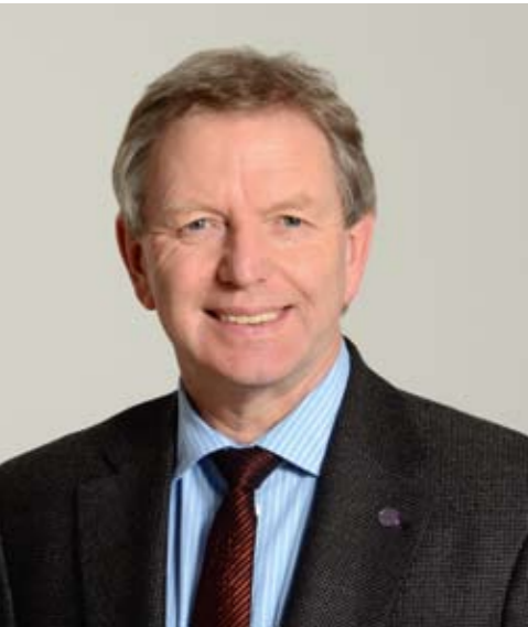
Jochen Bohl Landesbischof der Evangelisch- Lutherischen Landeskirche Sachsens