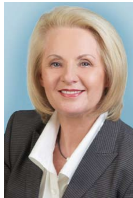
Christine Clauß Sächsische Staatsministerin für Soziales und Verbraucherschutz